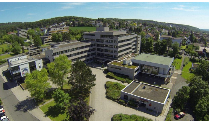
Das Kreishaus von oben.

Wenn man persönliche und berufliche Perspektiven verbessern und herausfinden will, wo die eigenen Stärken liegen, dann bietet das FSJ im politischen Leben in unserem Fachdienst Bürgerbeteiligung und Ehrenamtsförderung in der Stabsstelle Dezernatsbüro der Landrätin die Möglichkeit dazu.