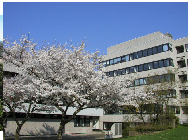
Das Kreishaus in Marburg-Cappel bietet auch Möglichkeiten für eine entspannte Mittagspause im Grünen.