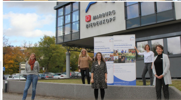
Der Fachdienst Bürgerbeteiligung u. Ehrenamtsförderung