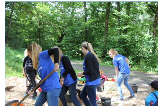
... beim Aufbau einer Spielhütte für einen Kindergarten