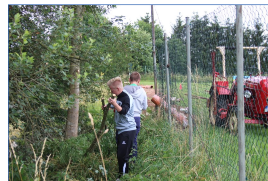
... bei Aufräumarbeiten am Sportplatz