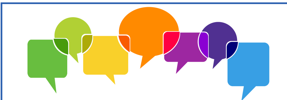
Bild: Vielstimmigkeit und Gesprächsplattformen — Wie können Jugendliche besser einbezogen werden?

Mehr Informationen und kommende Veranstaltungen unter: www.mein-marburg-biedenkopf.de