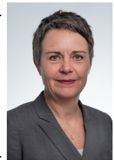
Landrätin Kirsten Fründt

Und nun schauen wir, welche Möglichkeiten uns das nächste Halbjahr bietet. Sehr gerne werden wir uns wieder persönlich mit Ihnen treffen und beides, digital und analog, sinnvoll miteinander verbinden.