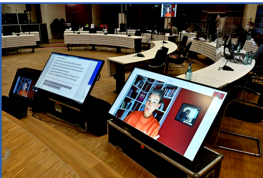
Bild: Ein Blick hinter die Kulissen bei der digitalen Veranstaltung

Der Landkreis Marburg-Biedenkopf war Gastgeber der digitalen Jahrestagung der Allianz Vielfältige Demokratie. Die Mitglieder des Netzwerkes tauschten sich über die Chancen und Herausforderungen digitaler Bürgerbeteiligung sowie über Open Government aus. Der Kreis engagiert sich seit 2015 in der Allianz Vielfältige Demokratie, die als freiwilliger Zusammenschluss von Vertreter*innen von Verwaltungen, der Politik sowie zivilgesellschaftlichen Organisationen das Thema Bürgerbeteiligung, insbesondere im Hinblick auf Demokratieentwicklung, voranbringen.