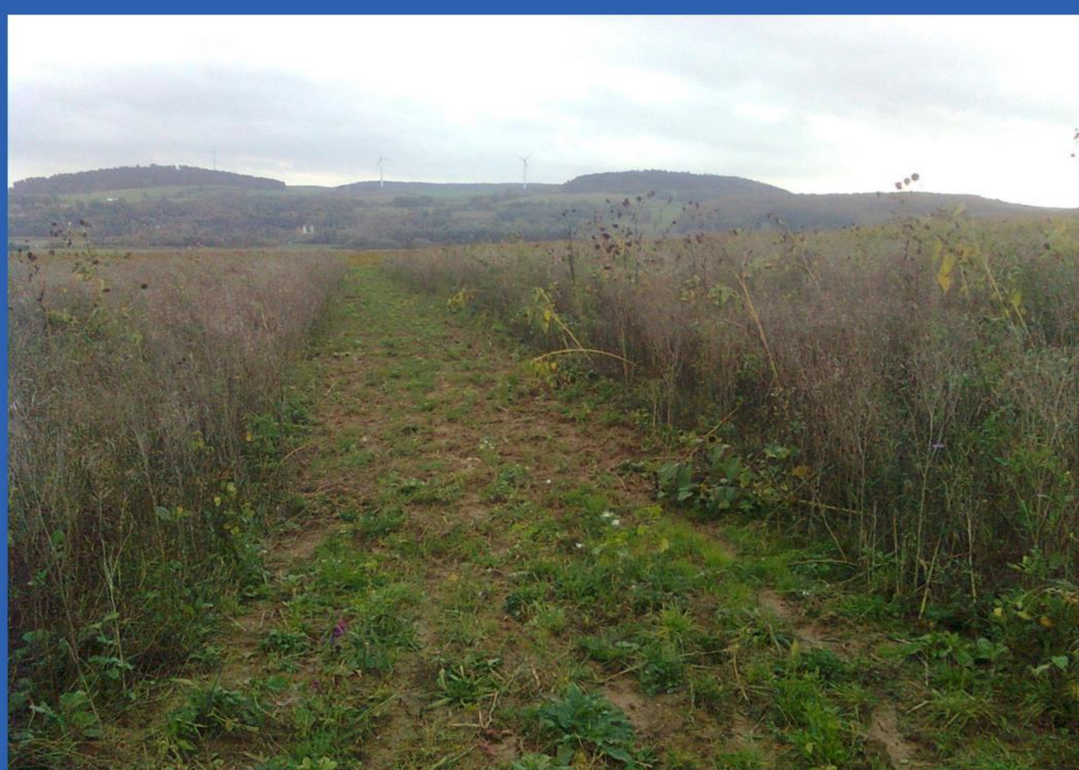
Schwarzbrachestreifen im Okt. 2014